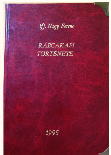
(Ifj. Nagy Ferenc: Rábcakapi története, 1995 Nagy Ferenc: Tárnokréti, Rábcakapi hídjai, 2016)

A világháborúk sok helyi család életébe hoztak könnyeket és gyászt. Az első világegés borzalmairól tudósított az 1910-es évek közepén különleges verseiben Győrök György, Rábcakapiból behívott katona és költő, aki költeményeiben a pusztítás helyett az életre, háború helyett a békére esküdött. Hitvallása szerint „A lélek útján nem veszhetek el. Az isteni menedéket nem lőhetik szét aknavetők, nem fertőzhetik meg uszítások. Az isteni menedék minden időben megmarad.”