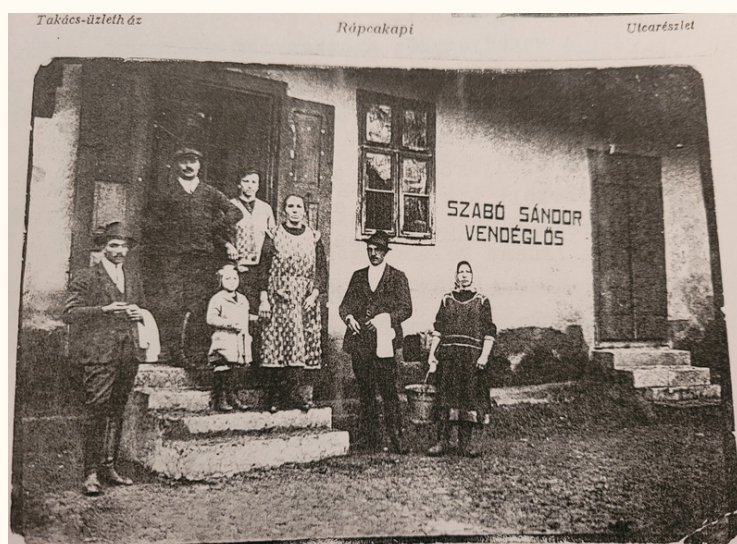
(Rábcakapi életkép a múlt századból)

1952 márciusában az egész ország „lázban égett” Rákosi Mátyás elvtárs 60. születésnapjának megünneplésére. Rábcakapiban sem történt ez másképp, még végrehajtó bizottsági határozat is született arról, hogy a dolgozók úgy díszítsék fel a házaikat, hogy a falu képe visszatükrözze a nagy nap jelentőségét, cserébe pedig egy kultúrában gazdag műsoros esttel ajándékozták meg a falu lelkes népét.