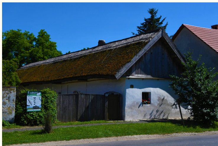
(1786-ban épült parasztház Rábcakapi Tájház)

Régi öregek az őseiktől hallott történetek után mesélték, gyakran előfordult, hogy mikor templomba mentek a szomszédos faluba, ladikokba szálltak és így tették meg az utat, mert a környéken tengernyi volt a víz. Mindezek mellett, az elzárt fekvés a vészterhes időkben igen jó védelmet is nyújtott, ennek egyik ékes példája az „Asszonysziget” földrajzi elnevezés. A színhagyomány szerint „valamikor a török időkben és a vallásüldözésben a fehérnépeket oda dugták el.”