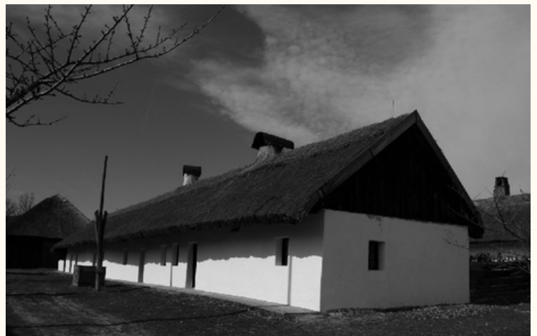
(Rábcakapi lakóház eredeti helyén, majd újjáépítve a Szentendrei Szabadtéri Néprajzi Múzeumban)