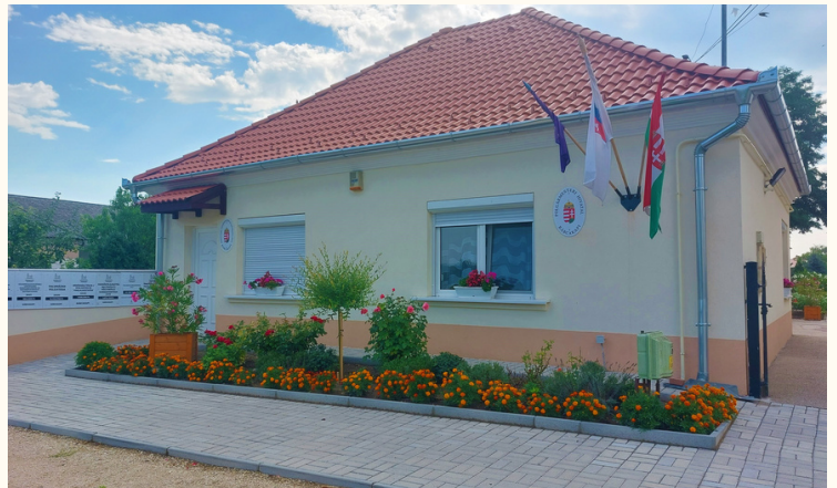
(Polgármesteri hivatal, Faluház és Könyvtár épülete)