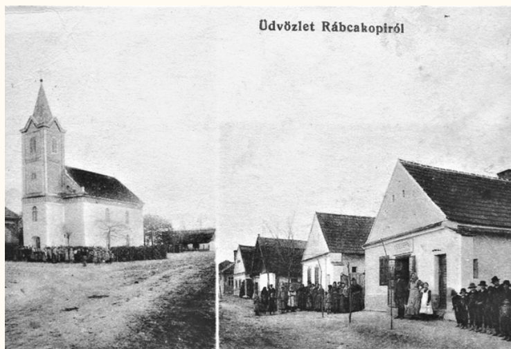
(Rábcakapi képeslap 1914-ből)

Egykor, a Hanság lecsapolása és a Rábca szabályozása előtt, a mocsárvilág ingoványos, bizonytalan talaján még minden más volt. Kiépített utak hiányában kocsik helyett csónakkal közlekedtek, és napjaink szépen gondozott gabona vagy kukorica földjei helyén öreg halászbárkák siklottak a vízen.